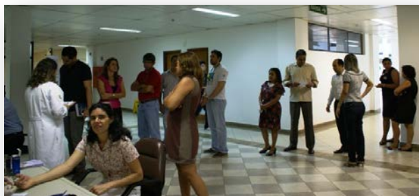
Via Direta, n. 13, ano X, 2014.

Almoço de confraternização entre os servidores da Secretaria Administrativa, juntamente com a Diretoria do foro, estagiários e prestadores de serviço.