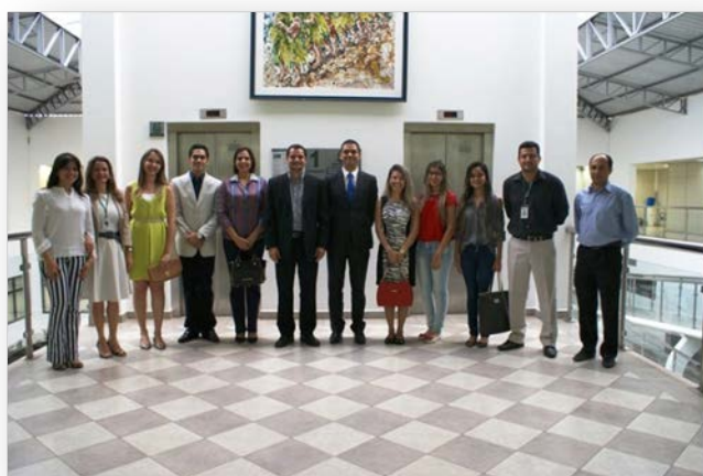
Via Direta, n. 17, ano X, 2014.