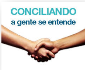
Via Direta, n. 11, ano X, 2015.