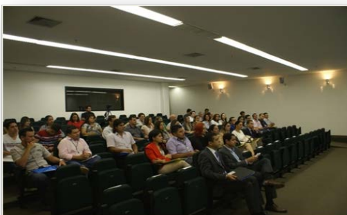
Via Direta, n. 40, ano 10, 2015.