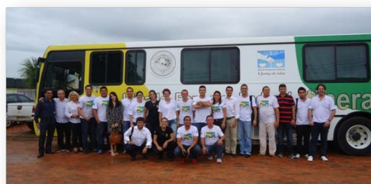
Via Direta, n. 15, ano X, 2014.