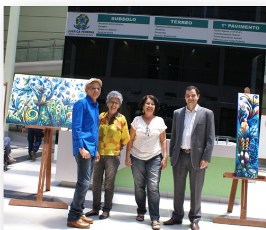
Via Direta, n. 11, ano X, 2014.