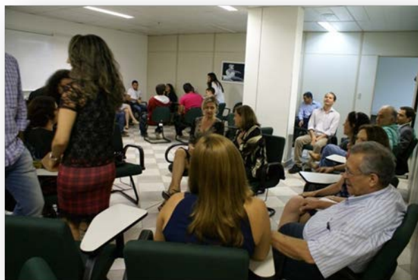
Via Direta, n. 17, ano X, 2014.

Almoço de confraternização entre os servidores da Secretaria Administrativa, juntamente com a Diretoria do foro, estagiários e prestadores de serviço.