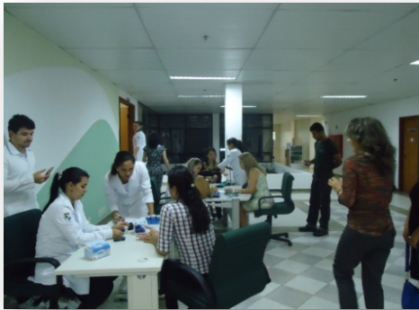
Via Direta, n. 18, ano X, 2015.