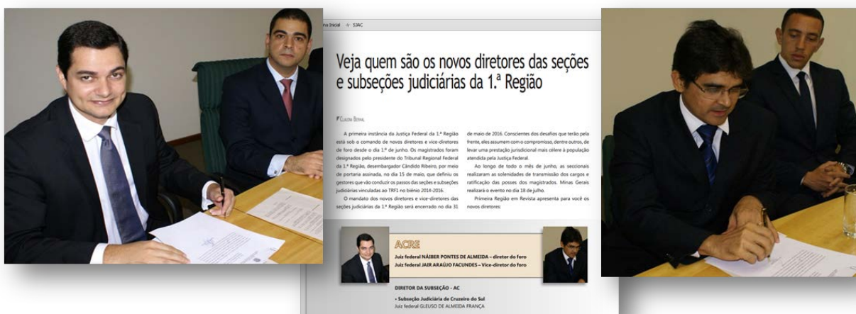
Notícia vinculada na Primeira Região em Revista, ano V, nº 46, jun 2014.