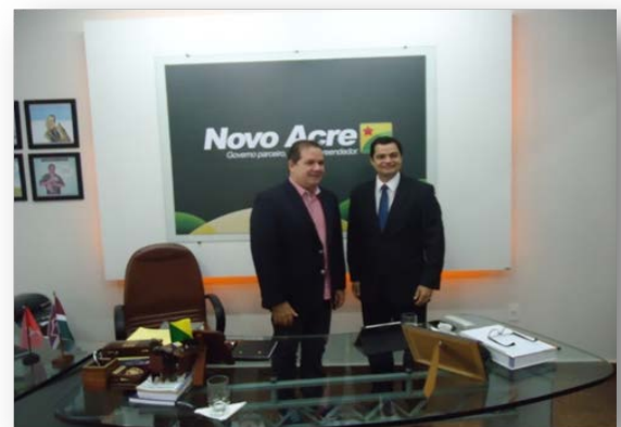
Via Direta, n. 19, ano X, 2015.