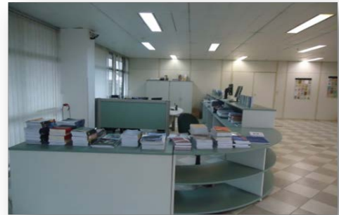
Via Direta, n. 19, ano X, 2015.