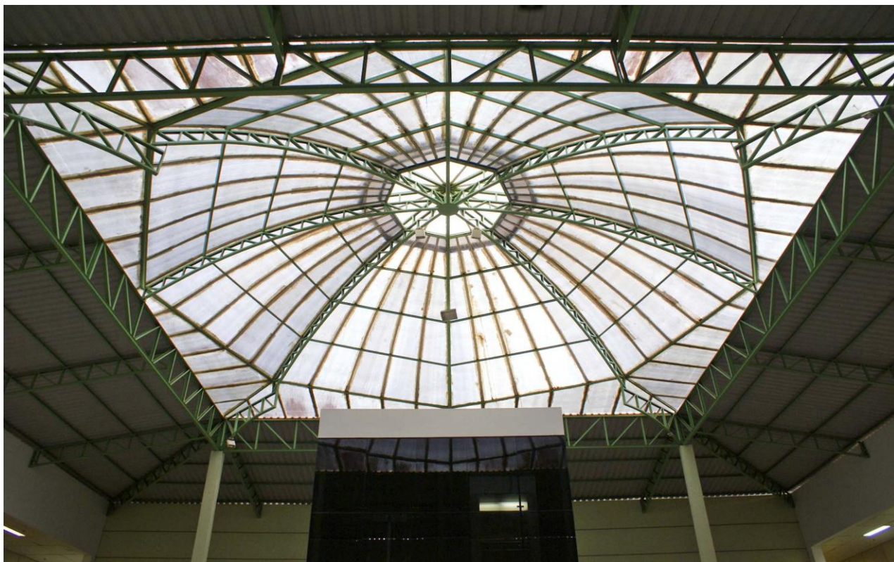
Foto 01: detalhe geral da cúpula a ser reformada. Todas as telhas de policarbonato serão trocadas. Será instalado forro em pvc sob as telhas metálicas.

- cobertura do hall de entrada do edifício sede da Seção Judiciária do Acre. (cobertura em telhas de policarbonato e forro em pvc sob a cobertura em telhas metálicas)