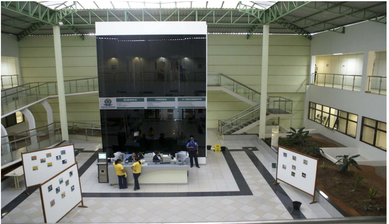
Foto 05: Vista geral dos locais a ser instalado o forro em pvc: sob as telhas metálicas em todo perímetro da cobertura do hall de entrada e no acabamento das treliças que se apóiam nos quatro pilares em concreto (acabamento lateral)