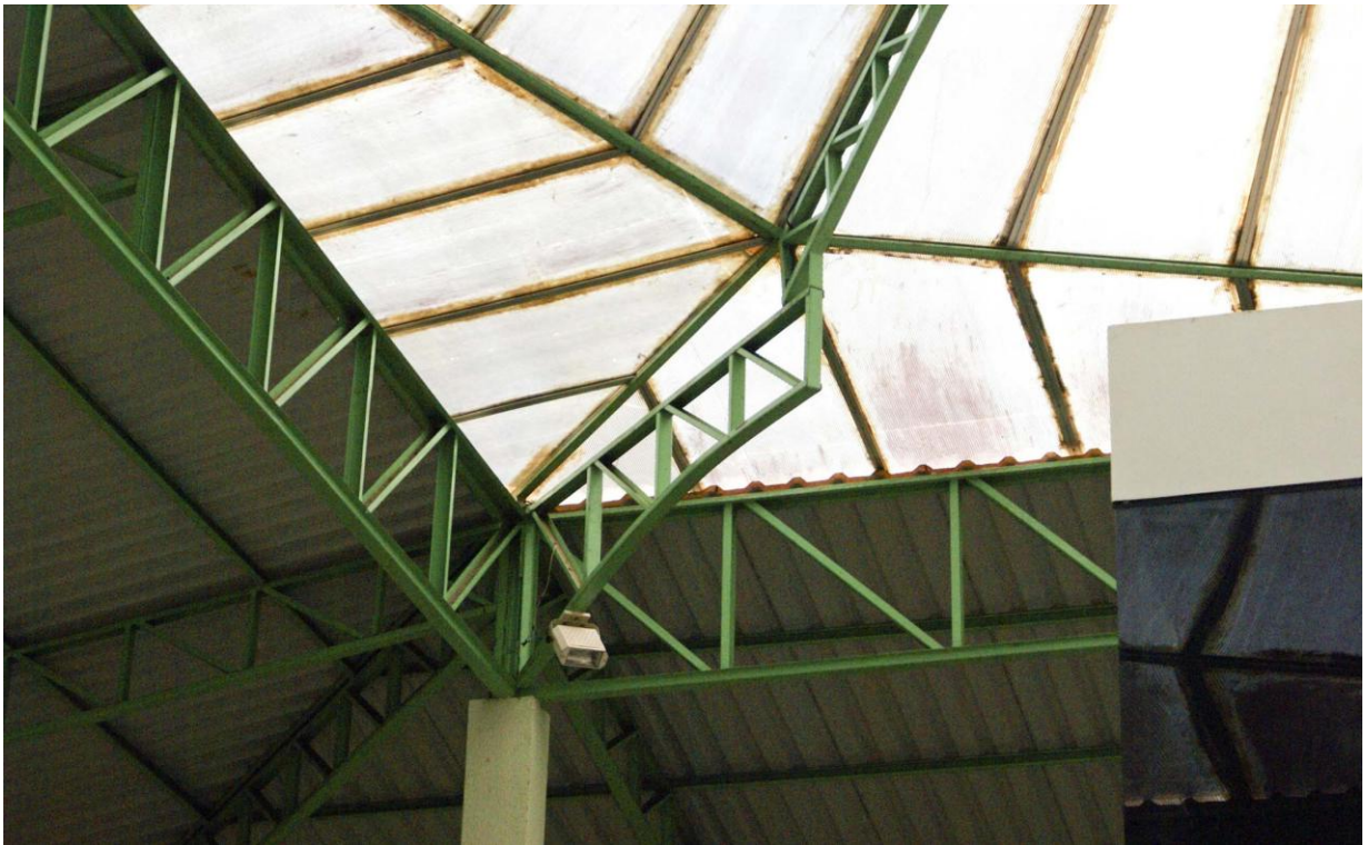
Foto 04: Vista geral do apoio da treliça metálica junto ao apoio metálico em balanço. Esse ponto (4 pontos em toda estrutura) será elevado para o abaulamento das novas telhas de policarbonato.

Para se efetivar essa elevação o perfil metálico (aço) que faz a junção dos dois panos de telhas (ângulo agudo) será retirado para recolocação de novo perfil metálico (em aço) de 10x5 cm, chapa #13 (2,5 mm), sobre calço metálico na treliça principal da cúpula. Esse perfil contornará toda cúpula na parte inferior.