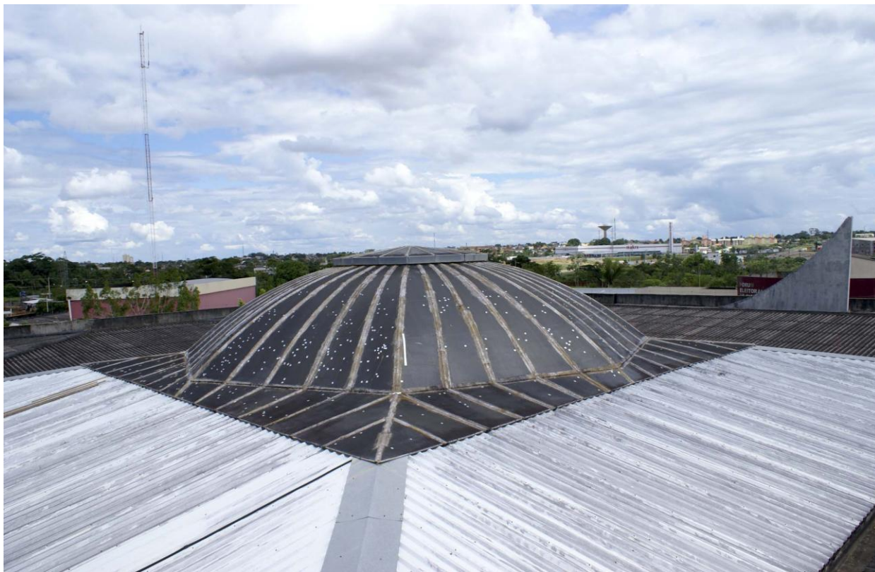
Foto 02: detalhe da vista superior na cobertura. Telhas em policarbonato na cúpula (que serão trocadas) e telhas metálicas no perímetro externo.