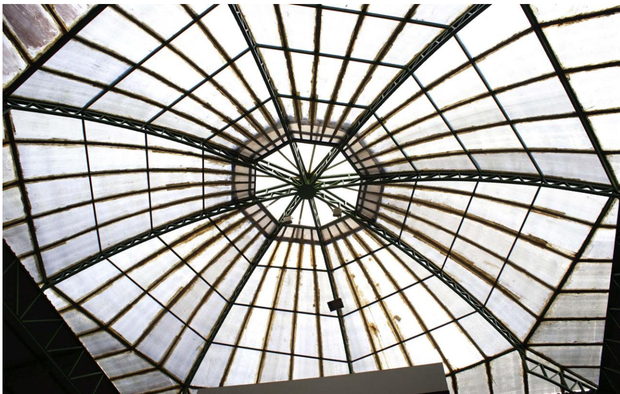
Foto 06: Remoção de pintura antiga na cor verde, aplicação de base em primer (zarcão) e nova pintura, na cor branca, de toda estrutura metálica da cúpula. Os perfis de alumínio de junção das telhas de policarbonato não serão pintados.

Serão admitidas as marcas dos fabricantes Sherwin Williams, Coral e Suvinil, 1ª linha.