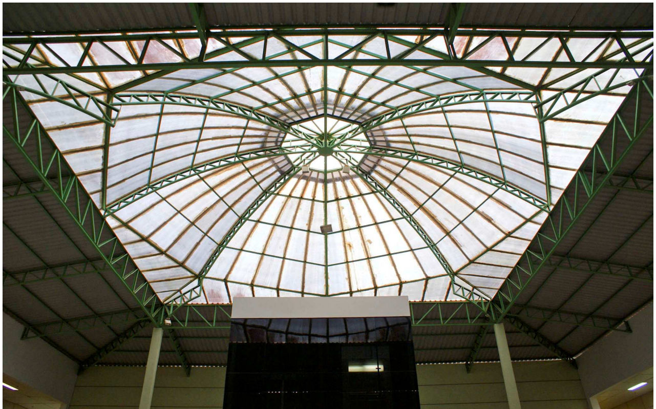
Foto 01: detalhe geral da cúpula a ser reformada. Todas as telhas de policarbonato serão trocadas.

As dimensões da cobertura são as seguintes: