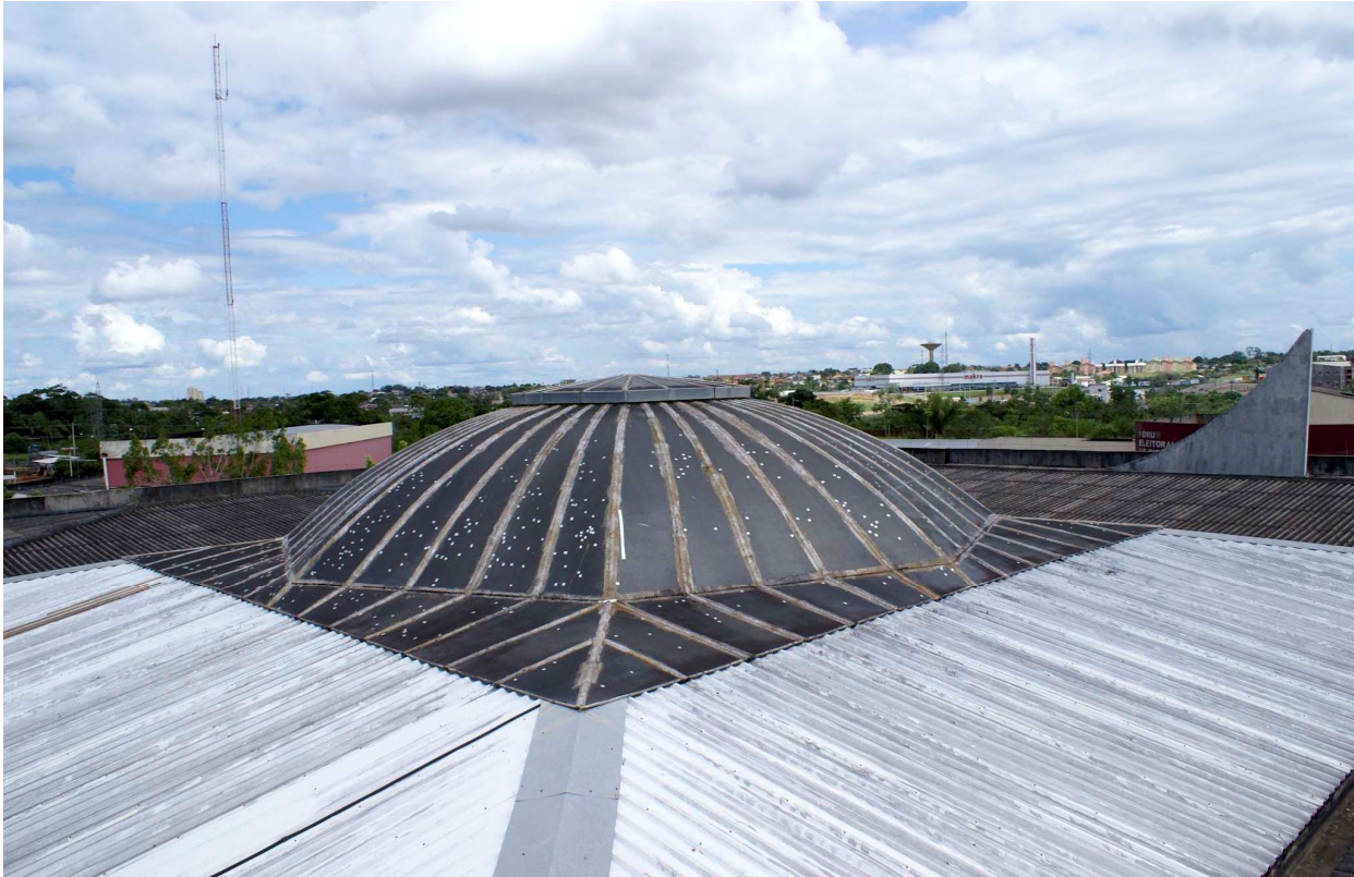
Foto 02: detalhe da vista superior na cobertura. Telhas em policarbonato na cúpula (que serão trocadas) e telhas metálicas no perímetro externo.