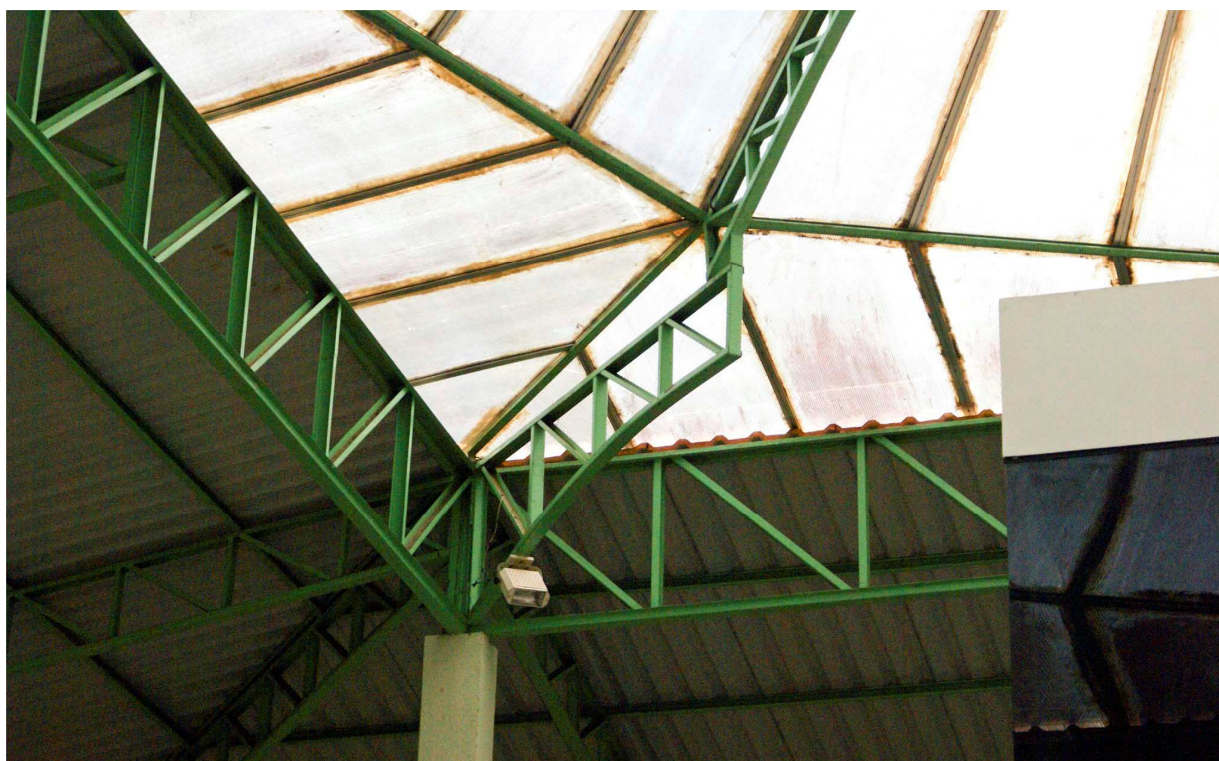
Foto 04: Vista geral do apoio da treliça metálica junto ao apoio metálico em balanço. Esse ponto (4 pontos em toda estrutura) será elevado para o abaulamento das novas telhas de policarbonato.