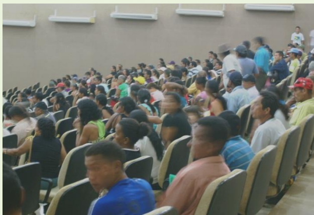
Cidadãos de Cruzeiro do Sul e adjacências aguardando atendimento

No último dia 15 de agosto, foram iniciados os trabalhos da fase de audiência do Juizado Especial Federal Itinerante em Cruzeiro do Sul e adjacências, relativos às ações previdenciárias.