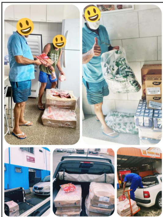
Entrega realizada no abrigo de idosos Lar Irmã Lourdes.

A campanha “Justiça no Prato”, lançada por servidores da SJBA em prol das famílias da comunidade de Sussuarana, foi o maior sucesso! O gesto de amor e empatia com o próximo se multiplicou em uma corrente de solidariedade. O projeto, que contou com o apoio institucional oferecido pela Direção do Foro, superou as expectativas e alcançou muitas famílias. Na mensagem abaixo, a equipe responsável contou um pouco dessa experiência e expressou o contentamento por todo o apoio recebido: