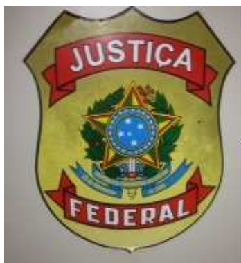
Distintivo do serviço de Segurança da Justiça Federal

Modelos a serem confeccionados e fixados nos uniformes táticos