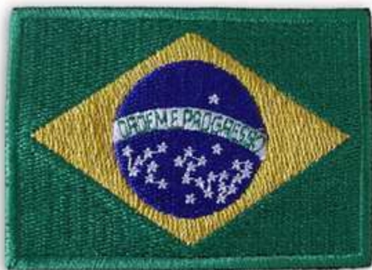
Bandeira da Republica Federativa do Brasil