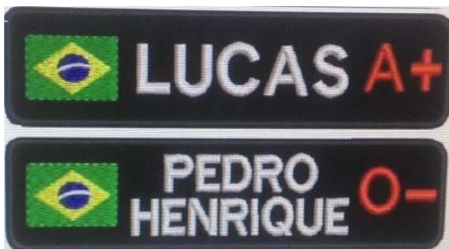
Biriba de identificação do nome do servidor e tipos sanguíneo

1 – Observação: deverá ser observados o tipo e as cores das letras para confecção pois em alguns casos diferem umas das outras inclusive nos modelos fornecidos como amostras.