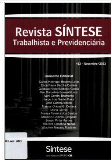
Revista Síntese Trabalhista e Previdenciária