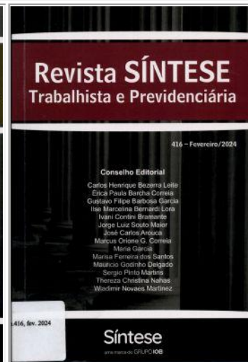
Revista Síntese Trabalhista e Previdenciária