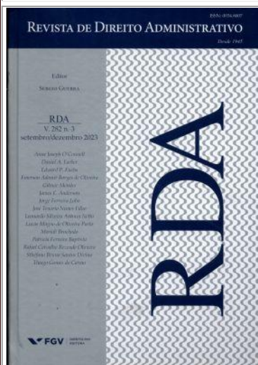
Revista de Direito Administrativo