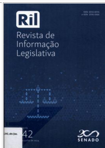
Revista de Informação Legislativa