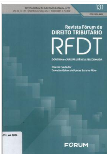
Revista Fórum de Direito Tributário