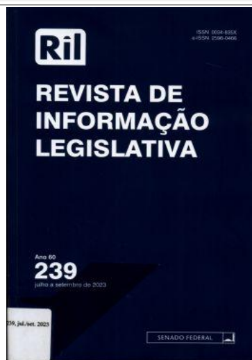
Revista de Informação Legislativa