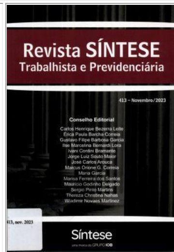
Revista Síntese Trabalhista e Previdenciária