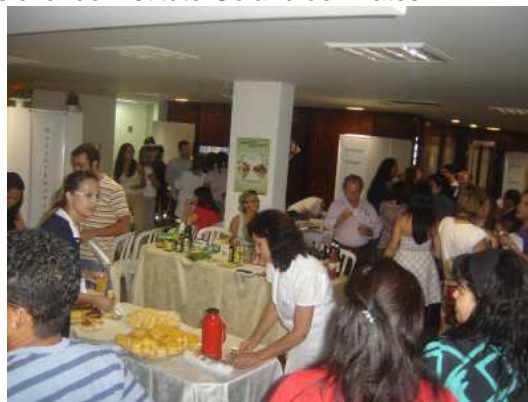
Momento de descontração durante a Feira.

Exercícios de ergonomia e alongamento realizados por profissional do Instituto Goiano de Pilates.