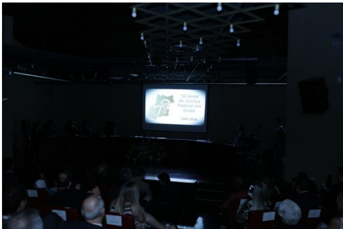
Apresentação do vídeo institucional