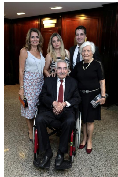
Ministro José de Jesus Filho e Familiares