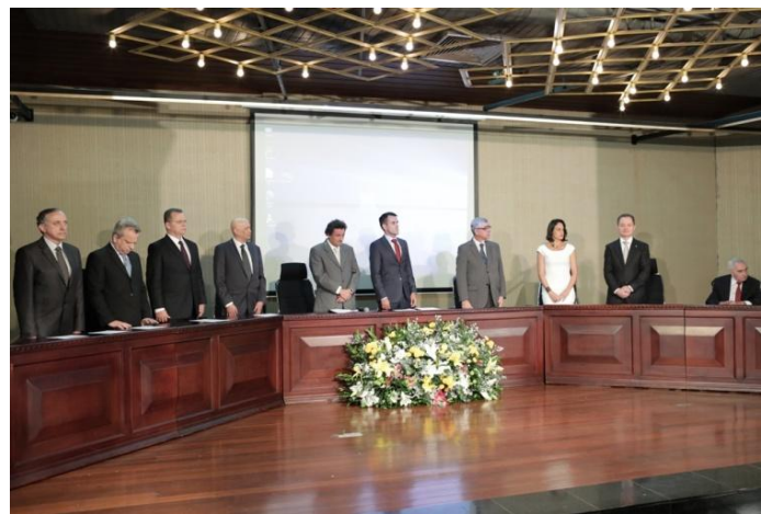
Mesa de Honra