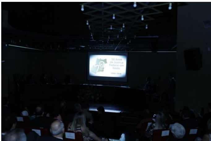
Apresentação do vídeo institucional