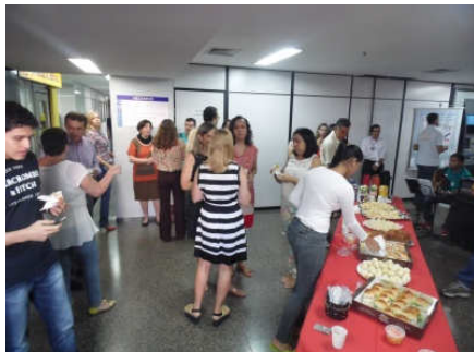
Lanche reuniu servidores

No dia 28 de outubro, em que se homenageia o servidor público, a Seção de Comunicação Social, com o patrocínio da Serjus e do Sinjufego, promoveu lanches de confraternização no edifício-sede e no Gama Dias.