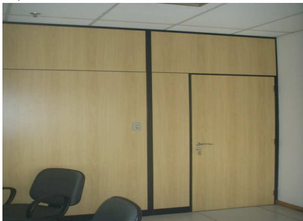
1) DIVISÓRIA A1 - PAINEL CEGO