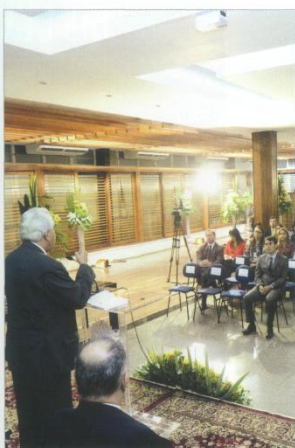
23 Painel Empossados novos diretores e assessores do TRF/1ª Região