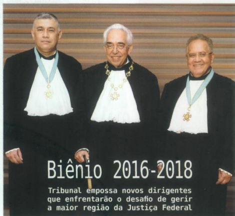
18 Capa Eleitos os administradores do TRF1 para o biênio 2016-2018