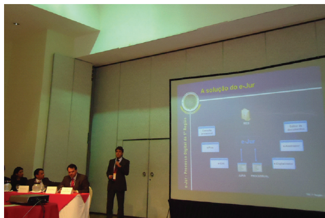
Apresentação do e-Jur no IX Seminário de Gestão Judicial e Acesso à Justiça

O sistema Processo Digital da 1ª Região – e-Jur foi premiado pelo Centro de Estudos de Justiça das Américas (Ceja) no IX Seminário de Gestão Judicial e Acesso à Justiça, ocorrido na Costa Rica em dezembro de 2011. Tendo sido o único projeto selecionado na área processual, o e-Jur passou a ser considerado referência nas Américas. O sistema encontra-se em funcionamento no Tribunal e na quase totalidade das seções judiciárias da 1ª Região, restando apenas a Seção Judiciária de Minas Gerais para concluir a implantação.